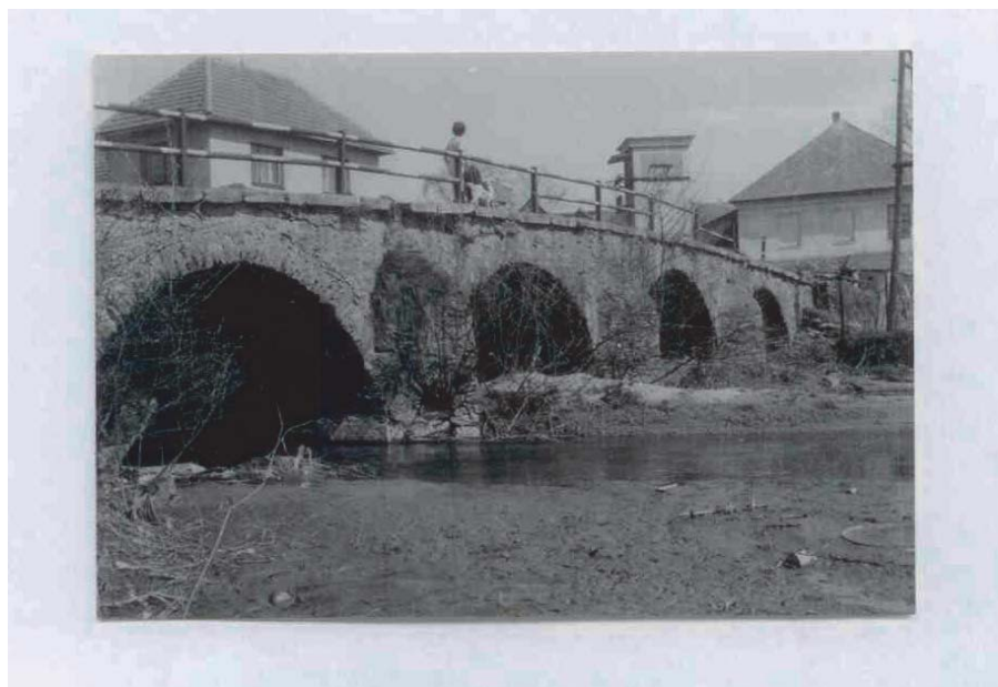
Jaro roku 1967