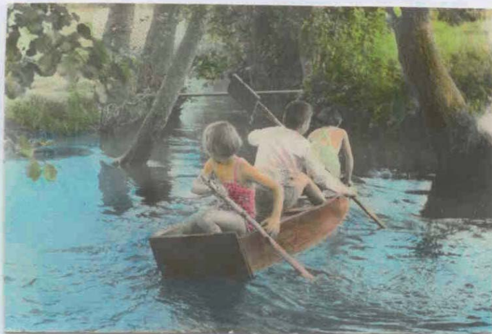
Oslava nad mostem pod lávkou